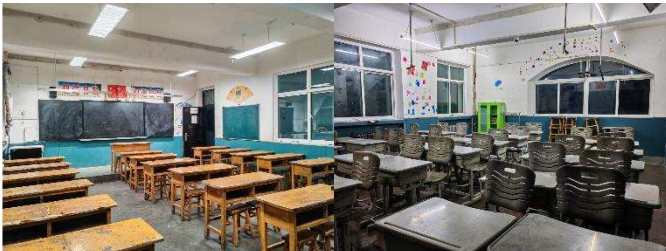
改造前后教室光环境（注：不是同一间教室）

通过厦门社会组织参与闽宁协作助力乡村振兴结对帮扶，7月一场跨越2000多公里的“山海之约”在宁夏回族自治区固原市泾源县温馨上演，与泾源县3所学校和10个村结对帮扶，捐赠24间教室，204盏护眼灯具，800盏护眼台灯，让孩子们在好光下学习的更好，看的更远。