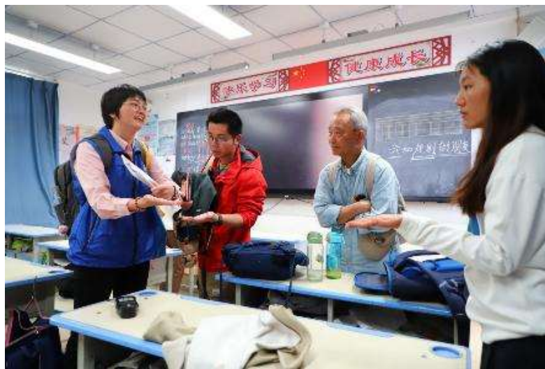
与项目校老师介绍健康光环境