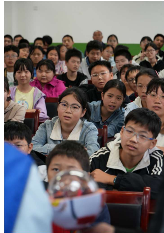
公益分享---近视防控小常识科普