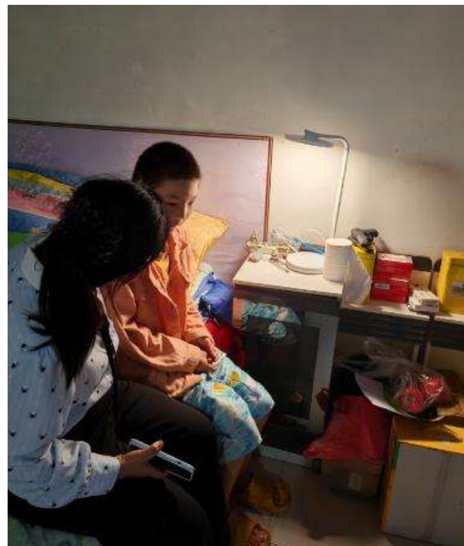
执行理事长入户与亲切孩子交流