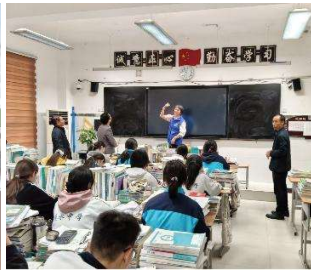
项目组指导黑板灯调试